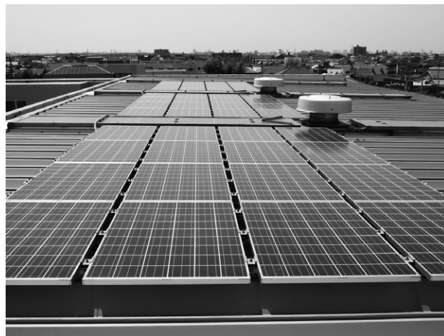
工場屋根に設置された太陽光発電システム