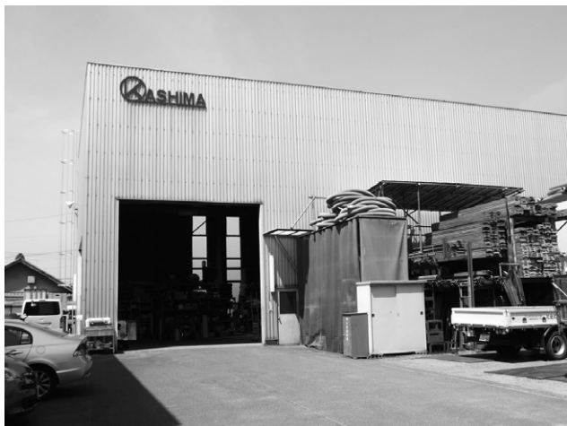
加島工業(株)の春日井工場

加島工業では、事業範囲の拡大に伴い、昭和49(1974)年2月15日付けで愛知県知事より、機械器具の設置工事に関する「建設業登録許可」を受けた。それを皮切りとして、同様に、昭和58(1983)年9月12日付けで「電気工事業登録許可」を、平成8(1996)年4月1日付けで「管工事・水道施設工事業登録許可」を、平成16(2004)年1月20日付けで「とび・土木工事業登録