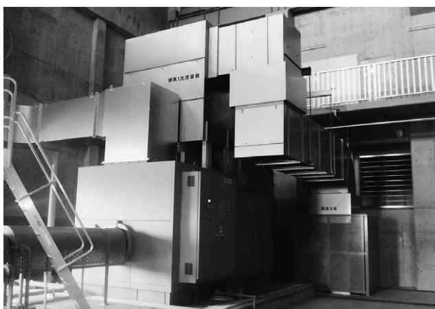
名港管理組合／堀川口排水機場に設置した横軸ガスタービン（二軸式）1,029kWの主原動機及び排気消音器とダクト